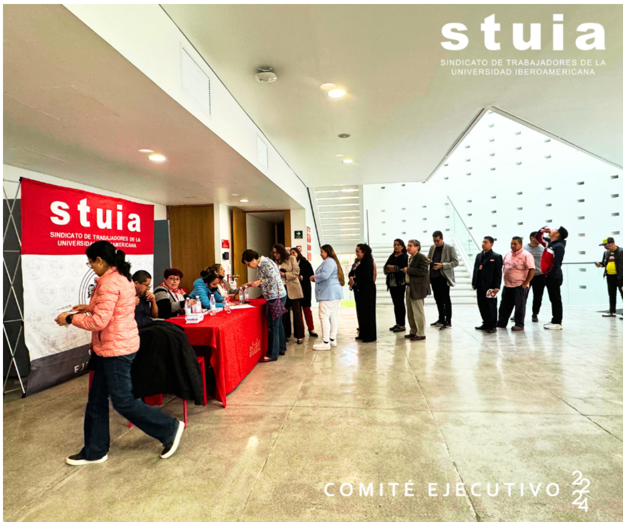
Participación de la Comunidad Sindicalizada en la Consulta de Convenio de Revisión Integral. 29 de febrero de 2024.