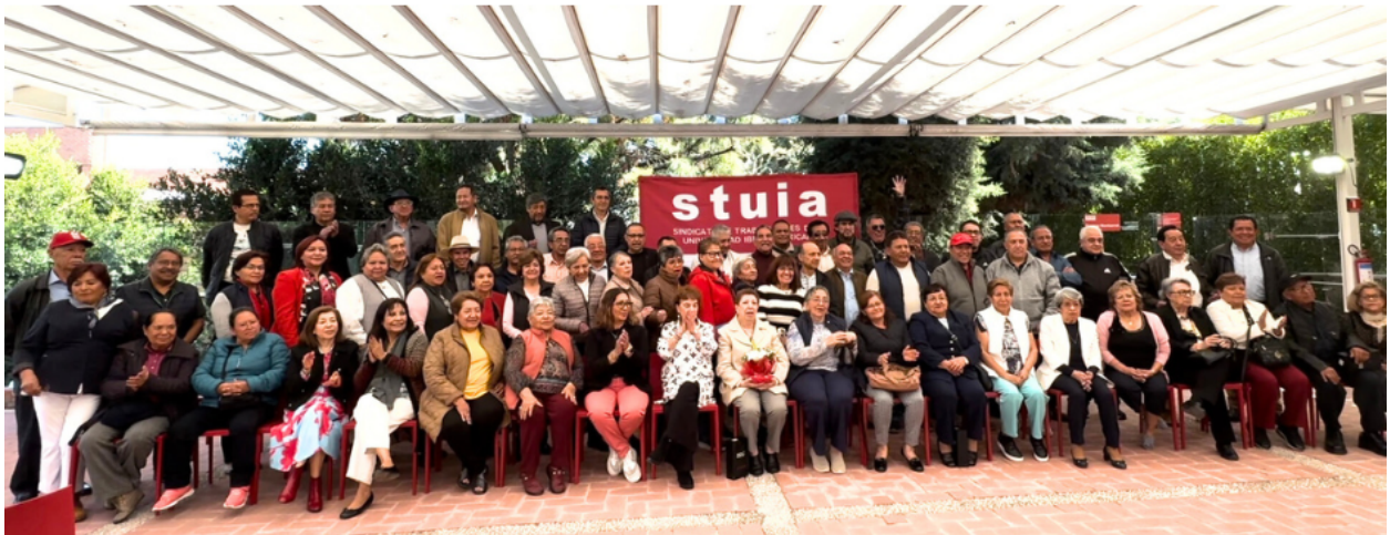
Desayuno de Jubiladas y Jubilados STUIA 2024.