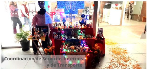
Coordinación de Servicios Internos y de Transporte