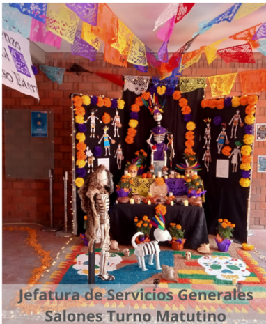
Jefatura de Servicios Generales Salones Turno Matutino