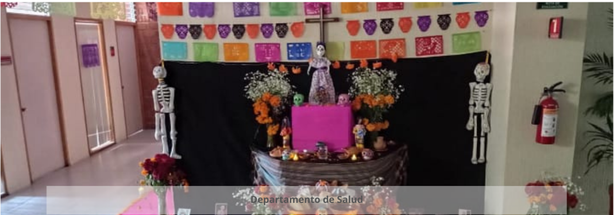
Departamento de Salud