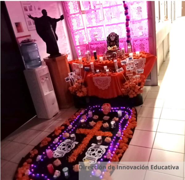
Dirección de Innovación Educativa