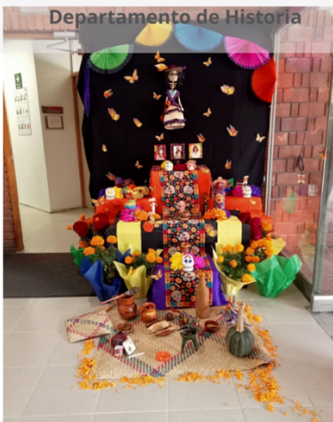
Departamento de Historia