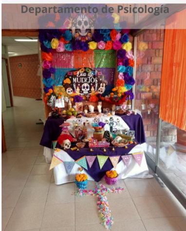
Departamento de Psicología