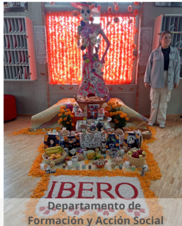
Departamento de Formación y Acción Social