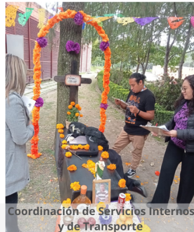
Coordinación de Servicios Internos y de Transporte