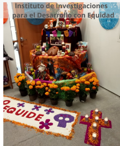
Instituto de Investigaciones para el Desarrollo con Equidad